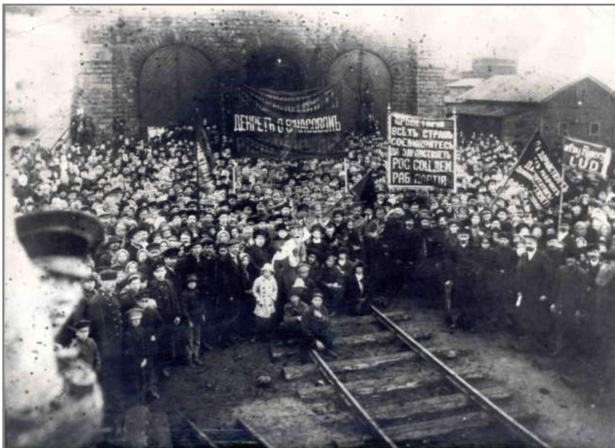
Митинг иланских рабочих в марте 1917 года