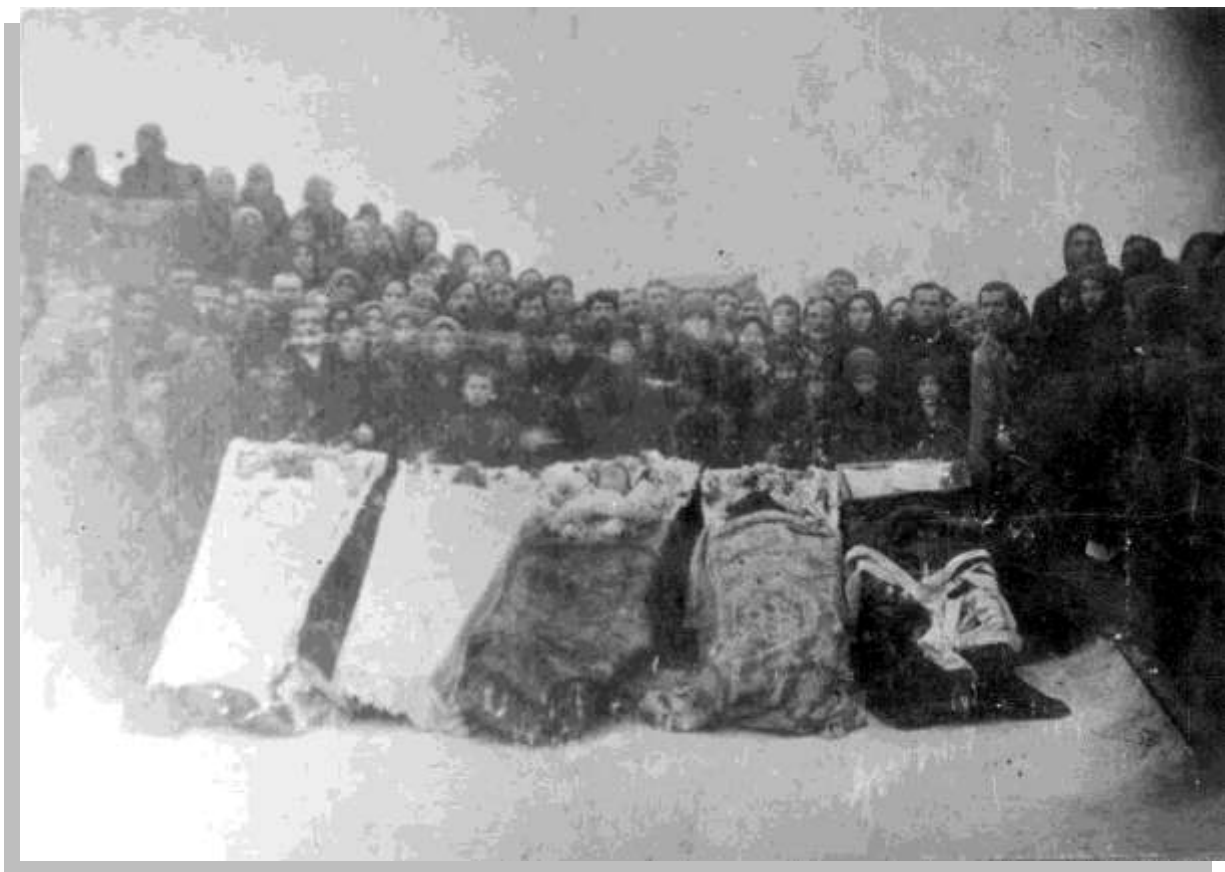
Похороны иланских рабочих в декабре 1918 года.

просачивалась кровь, от раны шел легкий парок. Офицер скомандовал ещё, но и после этого залпа Лекомских стоял. Офицер не вытерпел, выхватил у правофлангового солдата винтовку, подбежал к Лекомских и воткнул ему штык в глаз. После этого безжизненное тело старика сползло по стенке к подножию резервуара. Трупы рабочих возле резервуара находились до тех пор, пока не наступила ночь. Товарищам ночью удалось их подобрать и доставить домой.