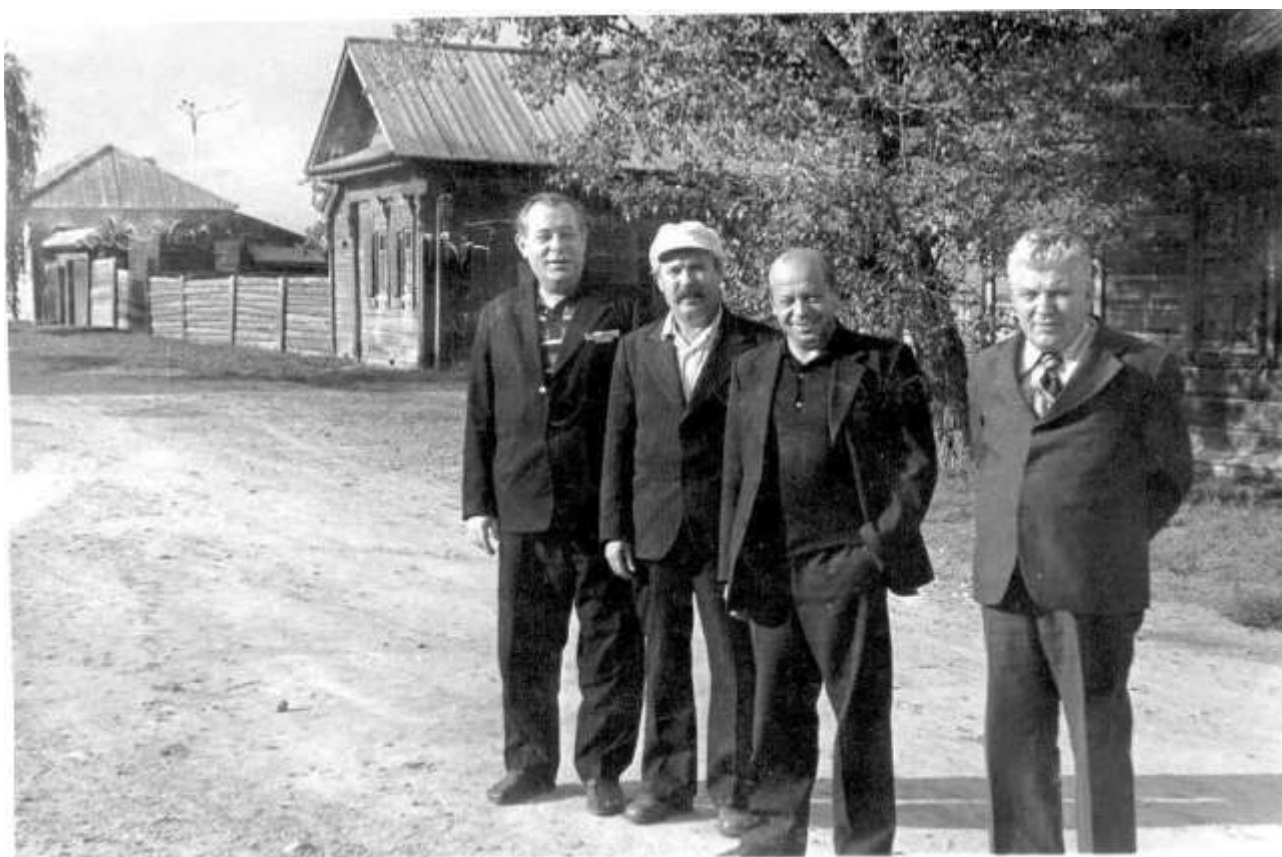
Шушенское 29 августа 1977 год