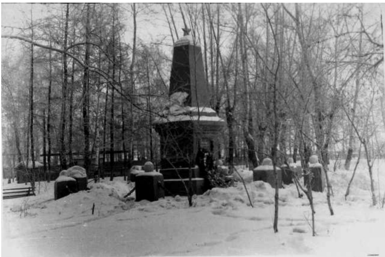
Памятник рабочим, погибшим в восстании 1918 года, установленный в железнодорожном парке.

Паровозный парк почти весь был доведён до такого состояния, что он совсем не мог пускаться в эксплуатацию. Запасные пути были забиты поломанными вагонами. Мрачную картину представляло депо. С разбитыми окнами, остановившимися станками и потухшей котельной, оно представляло собой кладбище, занесенное снегом.