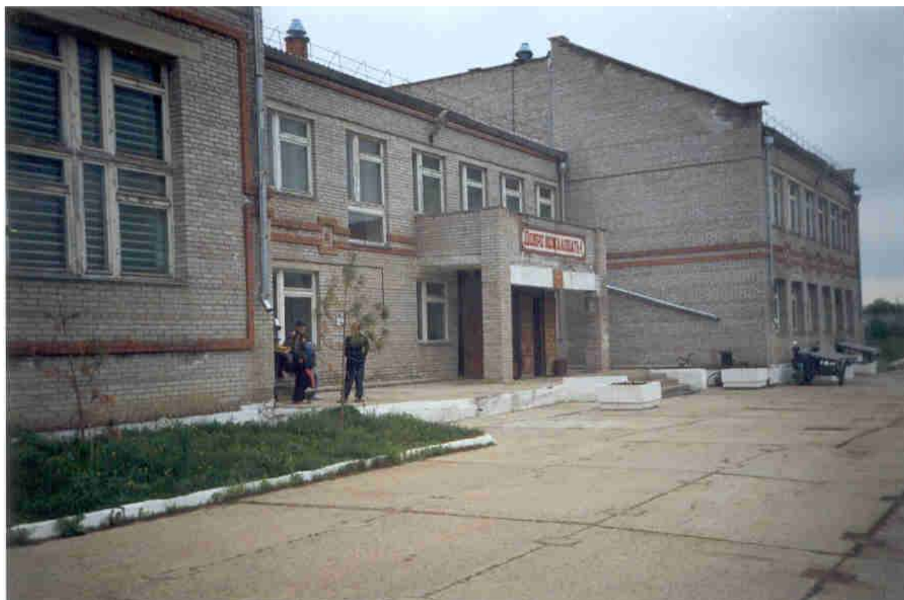
Новая школа открытая в 1998 году.