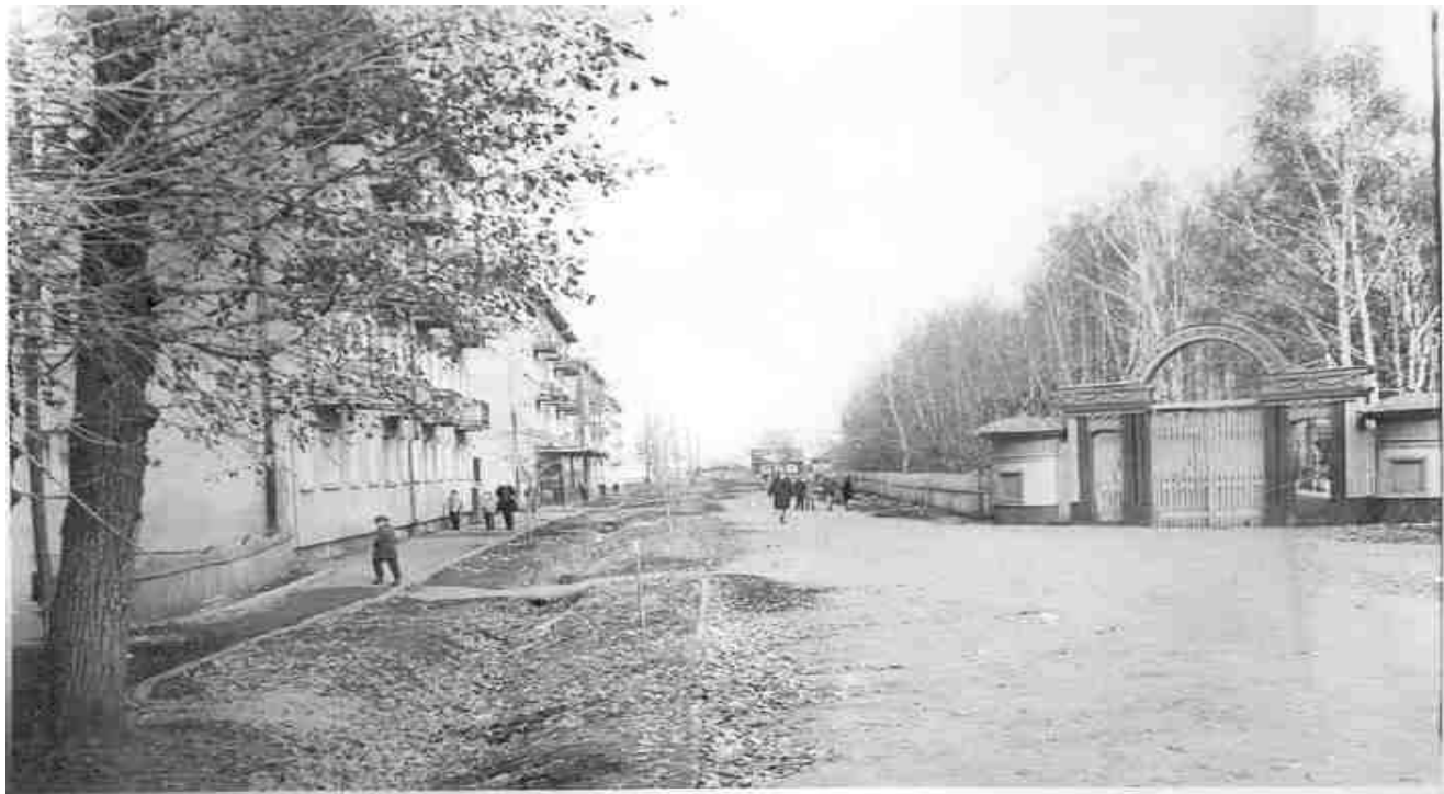
Железнодорожный парк любимое место отдыха Иланцев.

Жизнь в рабочем поселке Иланском становилась на рельсы созидательного труда. В авангарде за восстановление народного хозяйства шли большевики.