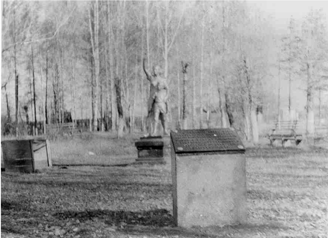
Тумба в железнодорожном парке установленная на месте расстрела иланских рабочих в декабре 1918 года.

Сила в Иланском победила. Разгул банд колчаковцев и красильниковцев, ещё больше ухудшил и до того тяжелое положение трудящихся. На все продукты питания выросли цены, людям не хватало хлеба. Многие семьи голодали. За голодом последовала эпидемия инфекционных болезней. Медицинской помощью больным не оказывалась.