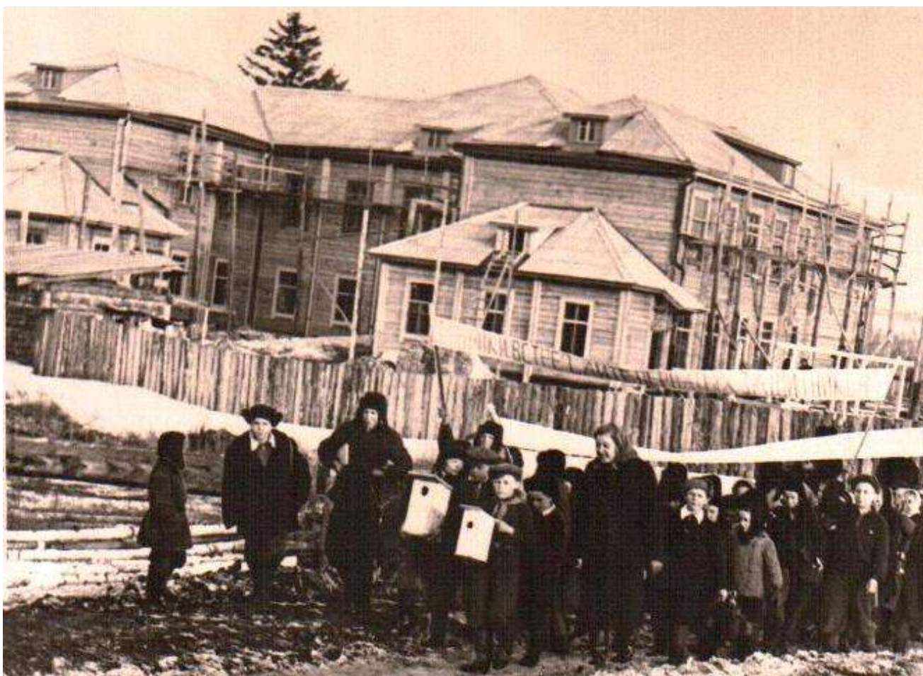
Идет строительство новой школы 1961 год.