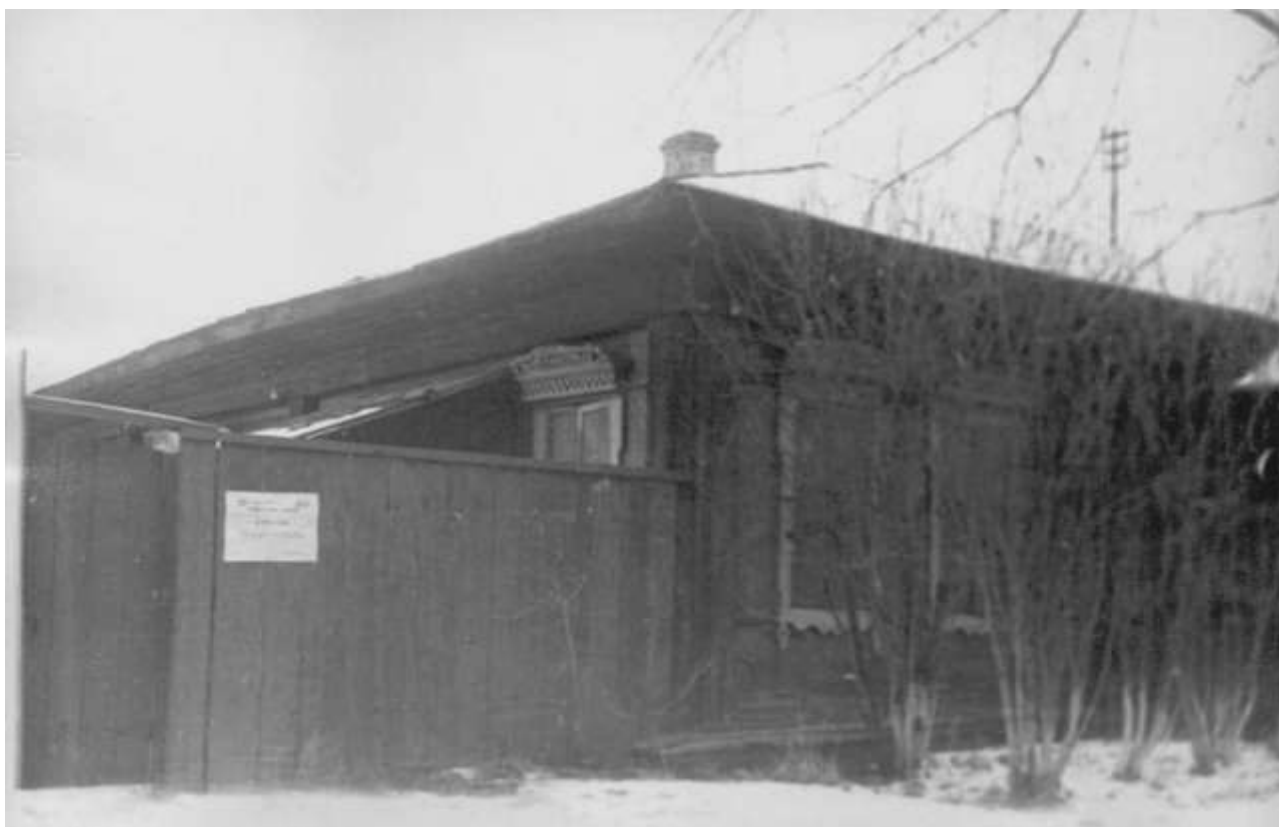
Здание районной библиотеки.

Это были годы нового роста экономической и культурной жизни.