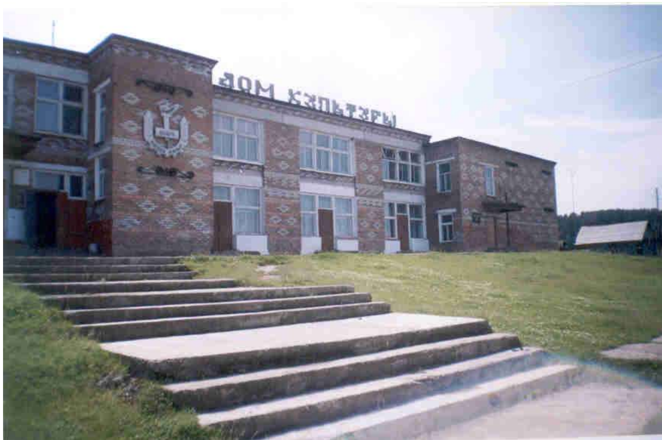
Дом культуры открыт в 1984 году.