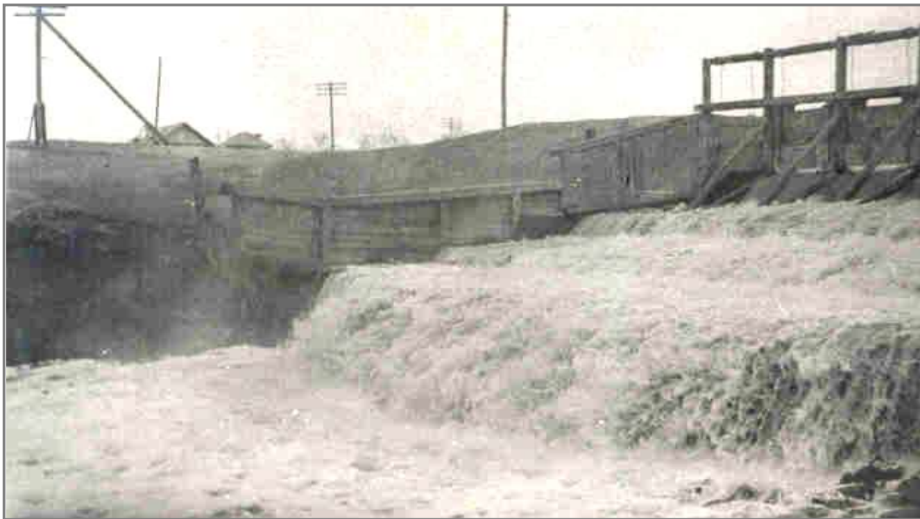
Плотина через реку Иланка.

В дни воскресников рабочие отремонтировали плотину, разгрузили более 10 тысяч кубометров дров и леса, сотни тонн камня и угля, большое количество других необходимых грузов.