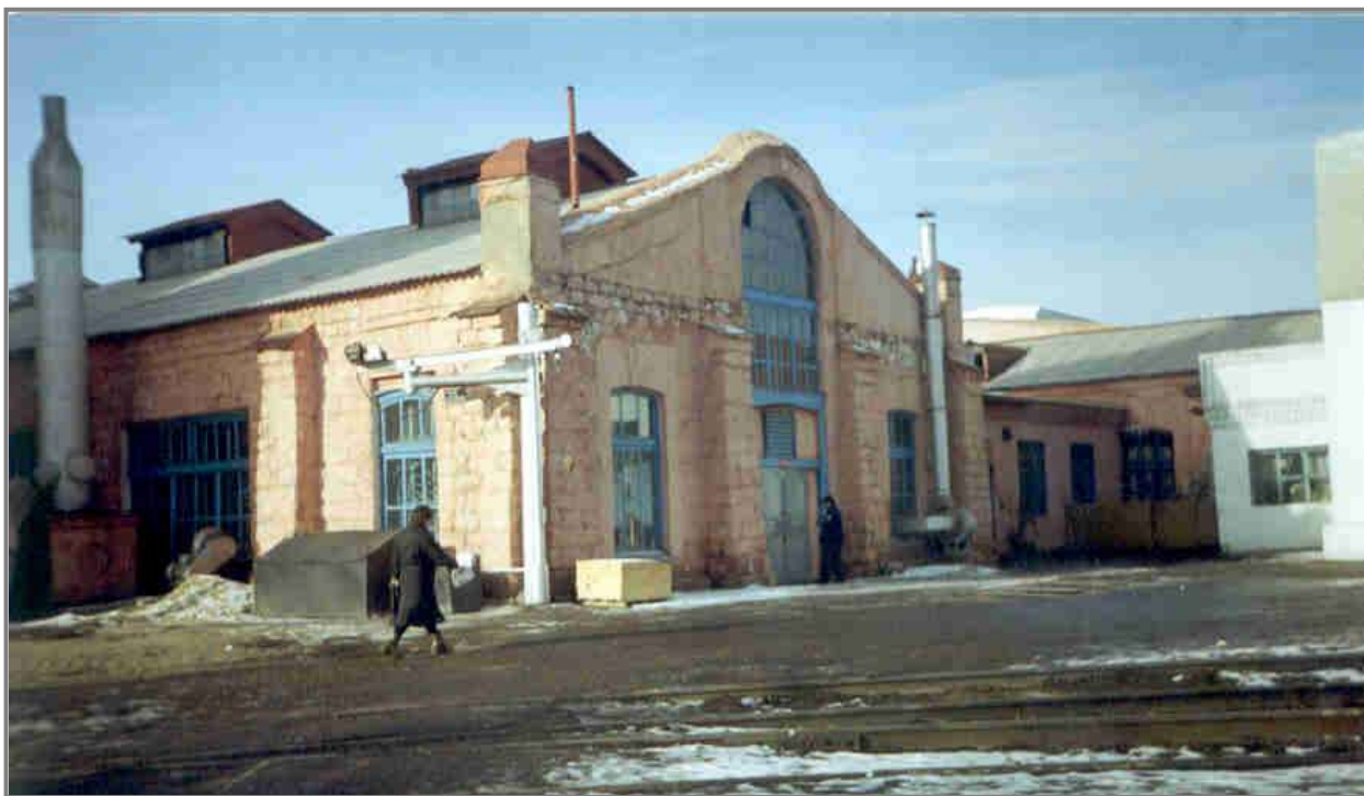
Мастерские Локомотивного депо свидетели событий 1906 года.