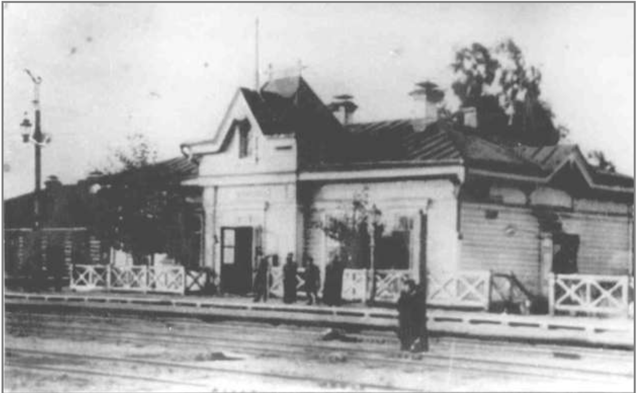
Здание железнодорожного вокзала.

За активную деятельность в Ленинском «Союзе борьбы за освобождение рабочего класса» были сосланы в Енисейскую губернию, верные соратники В.И. Ленина Глеб Максимильянович Кржижановский и Фридрих Вильгельмович Ленгник.