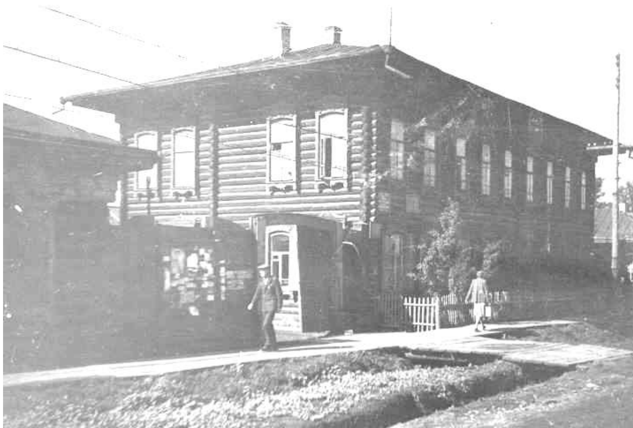
Редакция газеты «Иланский рабочий»

Для подготовки кадров железнодорожников в Иланском было открыто фабрично-заводское ученичество, в котором готовились кадры паровозников и вагонников.