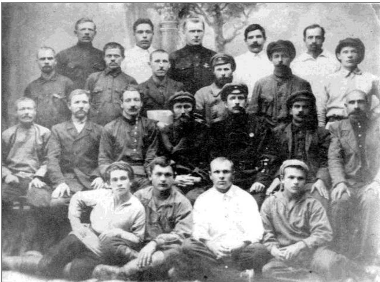
1924 год. Члены комсомольской ячейки Иланского и участники восстания 1918 года.

Вначале создалось основное комсомольское ядро из числа молодых рабочих паровозного депо. Первые комсомольцы стали направлять поселковую молодежь по руслу строительства новой жизни.