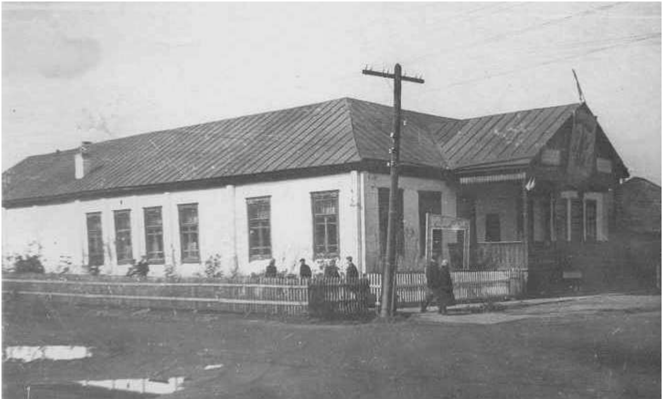
Районный Дом культуры.