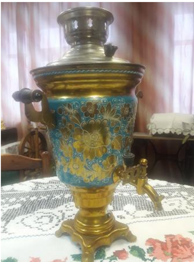
Тульский самовар, расписанный глазурью