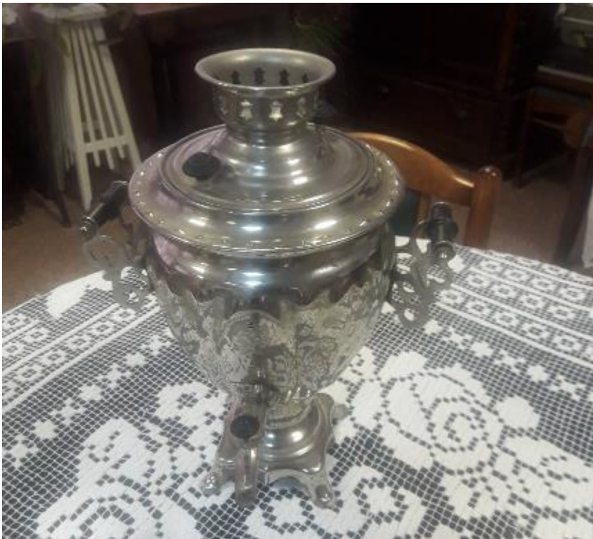
Самовар-кубок. ЗШВ. Завод «Штамп» им. Ванникова. Тула