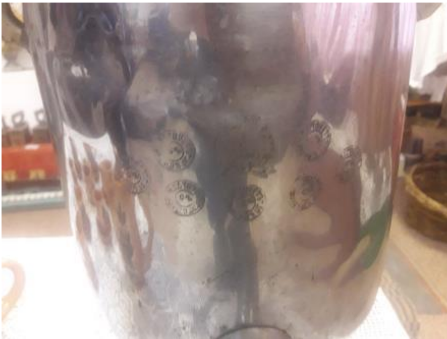
Самовар. Производство самоварного заведения братьев Баташевых. Тула 1870г.