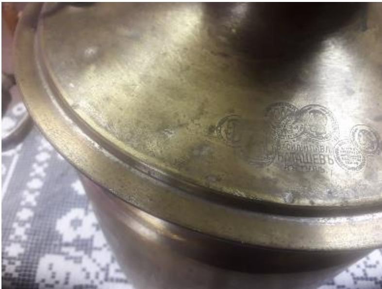
Самовар-банка.1907г. Баташев В.П.